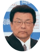
男川学区総代会長