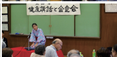
1人暮らし高齢者との食事会