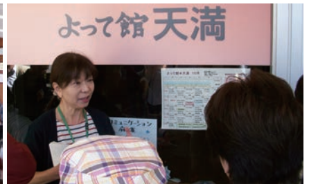
視察研修会 高山市 よって館